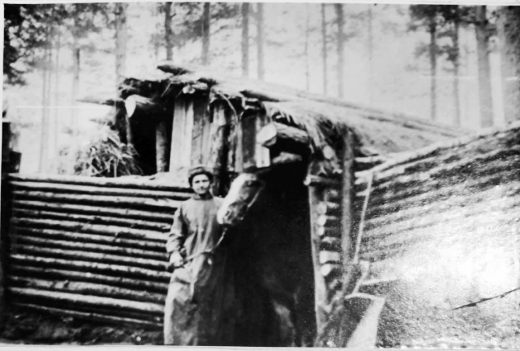
Стойла для раненых лошадей в лесу. 1941 – 1945 г. г.