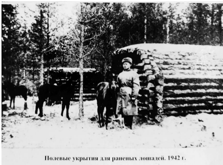
Полевые укрытия для раненых лошадей. 1942 г.